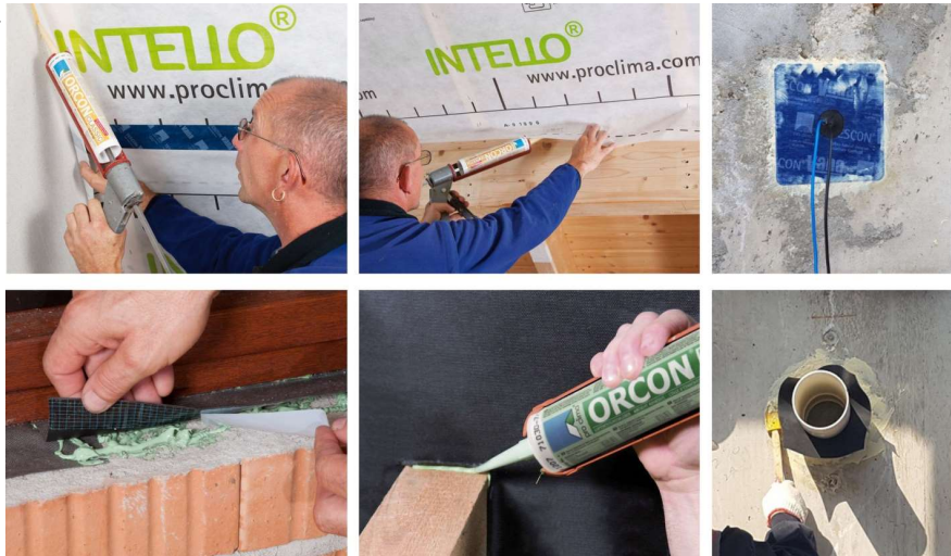
창호테이프에 시공 시 지그재그형태로 끊김없이 도포한다